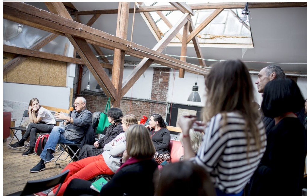
Diskuse / Discussion