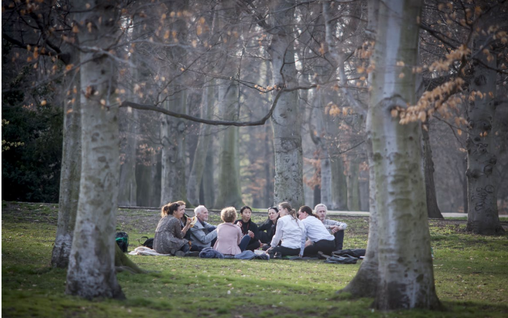
Artist trips