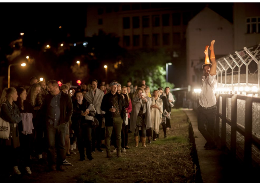
Opening 19. sezony / Opening of the 19 th season