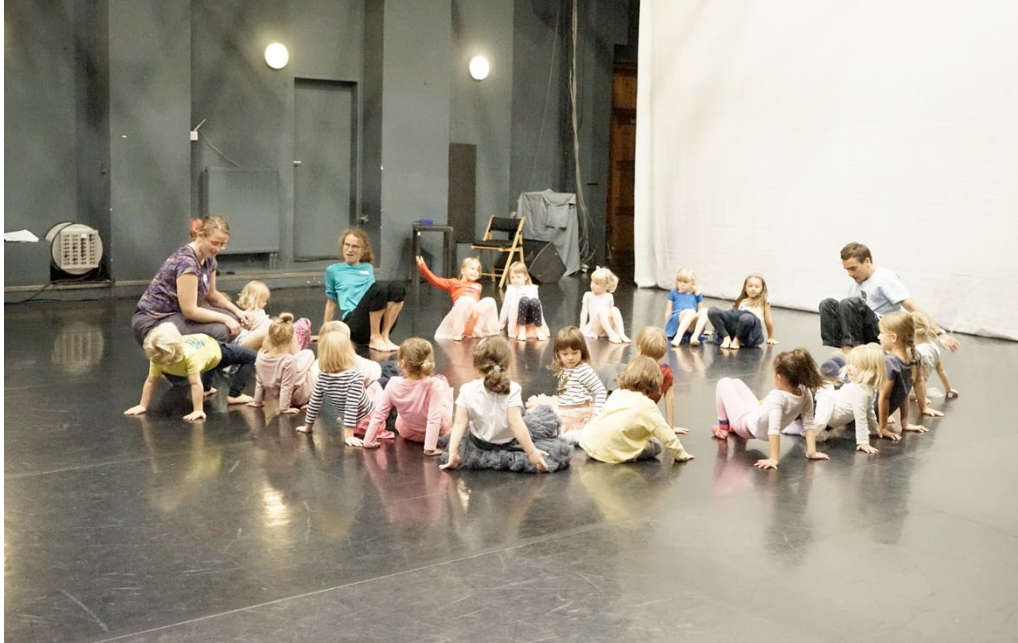
PONEC JUNIOR – Dětské studio divadla PONEC / PONEC JUNIOR – Children's studio of the PONEC theater