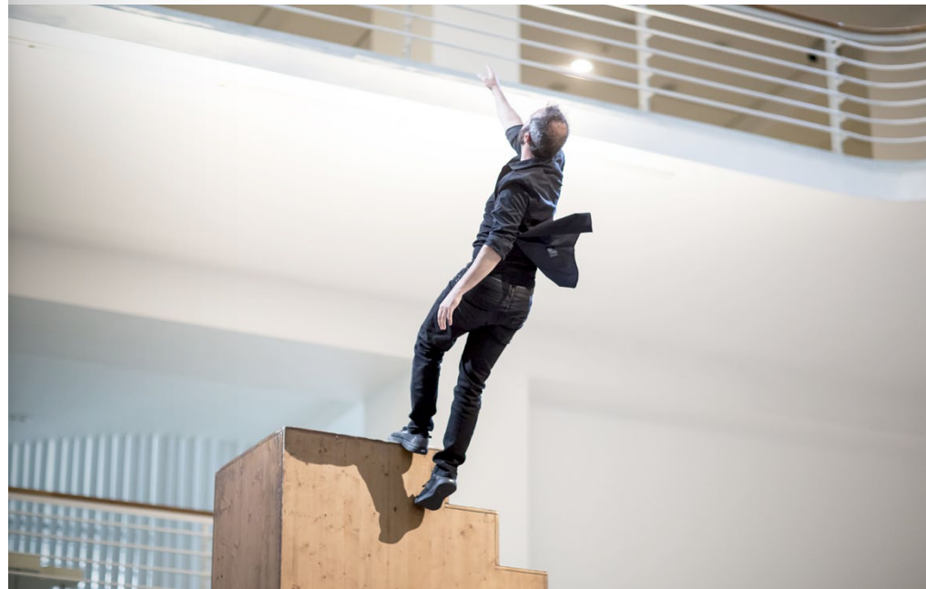
Zakončení festivalu TANEC PRAHA / Closing Ceremony of the TANEC PRAHA Festival – Yoann Bourgeois (FR): Tentative approaches to a point of suspension