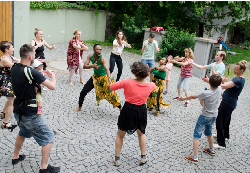
Workshop tradičního afrického tance ghanské oblasti / Workshop of traditional African dance of Ghana: Ghana Dance Ens. (GH)