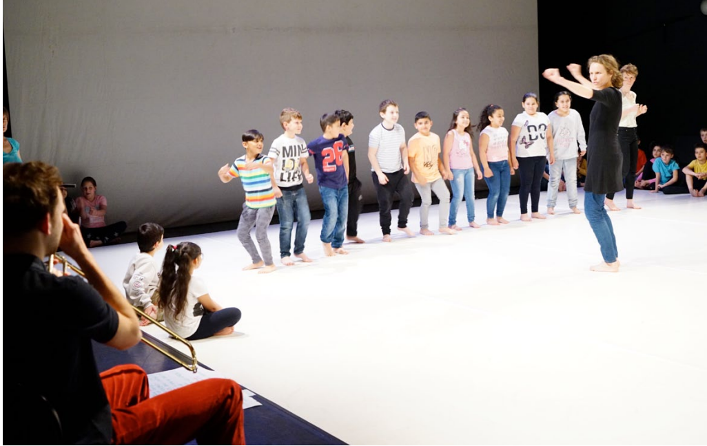
PONEC JUNIOR – Prezentace Tanec školám / Dance to Schools presentation