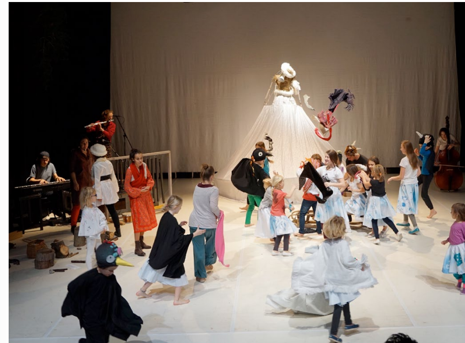
PONEC JUNIOR: Zima, Mráz a Oheň v nás / PONEC JUNIOR: Winter, Freeze and Fire in Us