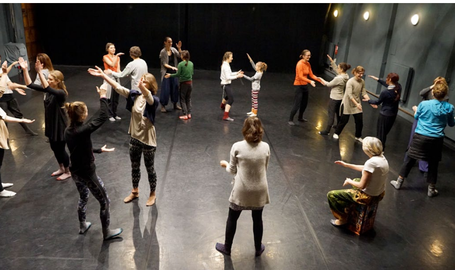
PONEC JUNIOR – Seminář Tanec školám / PONEC JUNIOR – Dance to Schools seminar